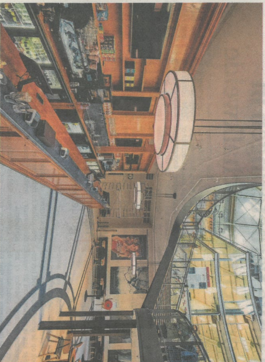
De foyer van de bioscoop, met links de bar en de jarenderigtverlichting