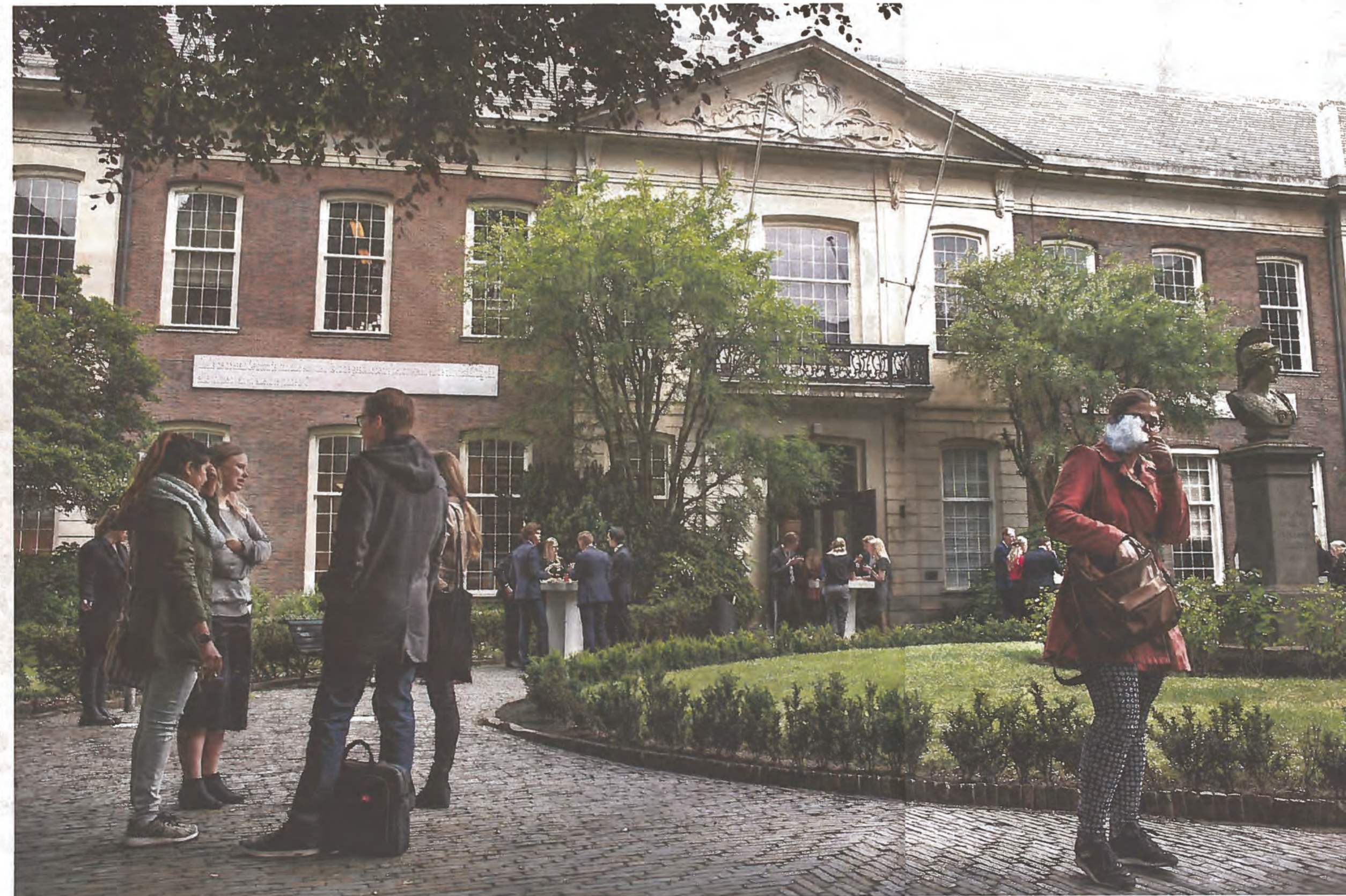
De Oudemanhuispoort, straks onderdeel van de Binnenstadscampus.