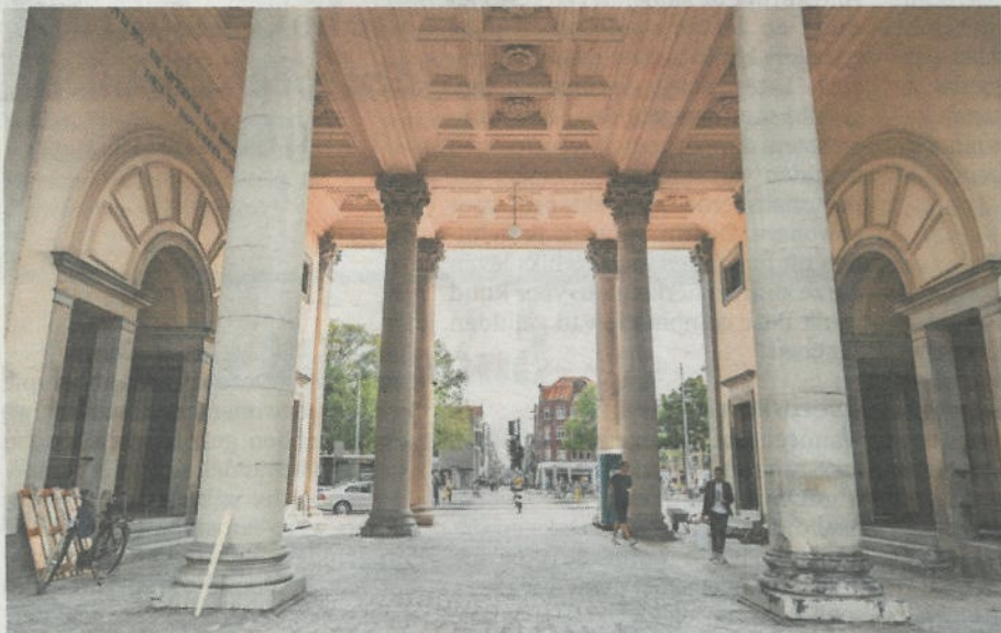
→ De portalen zijn niet in oersaaië grachtengroen geschilderd, maar in een chocoladebruin.

Ten slotte de vrees voor terrassen in de onderdoorgang. Stadsherstel heeft bedongen dat de uitbaters daar geen stoelen en tafels gaan plaatsen. Het zicht vanaf de dijk naar het park moet ongestoord blijven. Als de stad een herstelde poort rijk is, moet je daar wel zuinig mee omspringen.