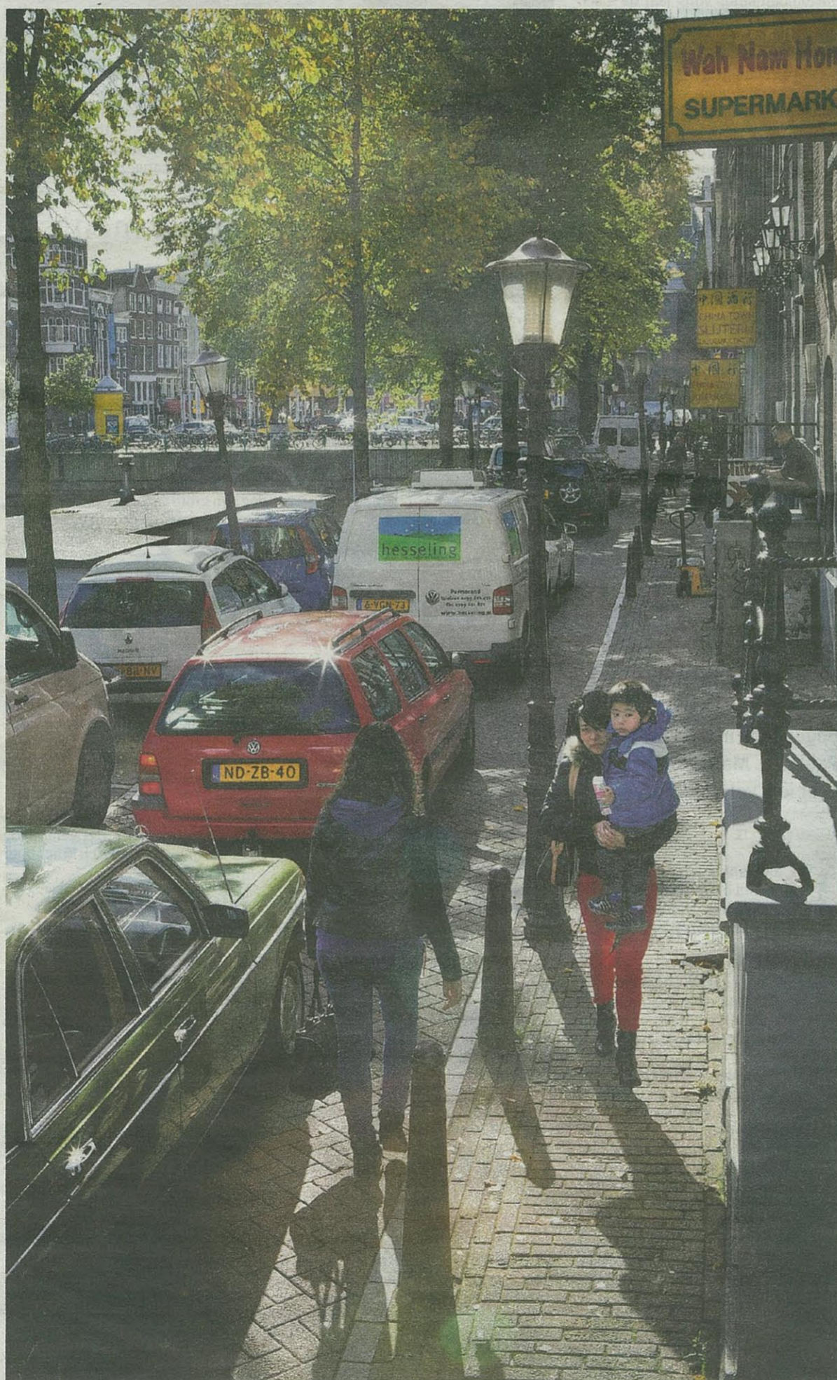
Lopen op dit deel van de Gelderse- kade betekent vaak lopen tussen de auto's, op de rijweg.

Vanavond overlegt het stadsdeel in het Bethaniënklooster met belanghebbenden.