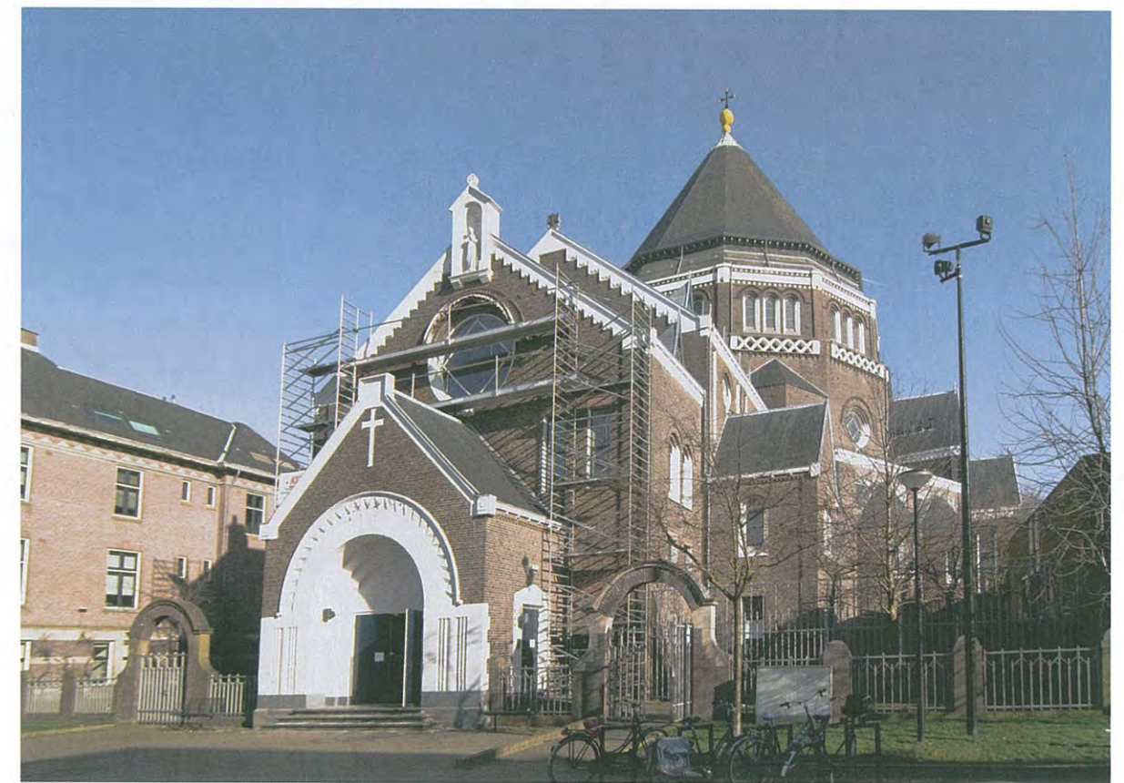
Gerardus Majellakerk in restauratie, 2011, foto Ernest Annyas.

We bevinden ons in de Indische buurt in Stadsdeel Oost, dat als een klaverblad gegroepeerd ligt, grofweg tussen het spoor naar Utrecht - Hilversum en het Flevopark. De wijk dateert grotendeels uit het begin van de twintigste eeuw. De eerste straatnamen, die zijn vernoemd naar eilanden en andere geografische aanduidingen in de voormalige kolonie Nederlands-Indië, dateren uit 1902.