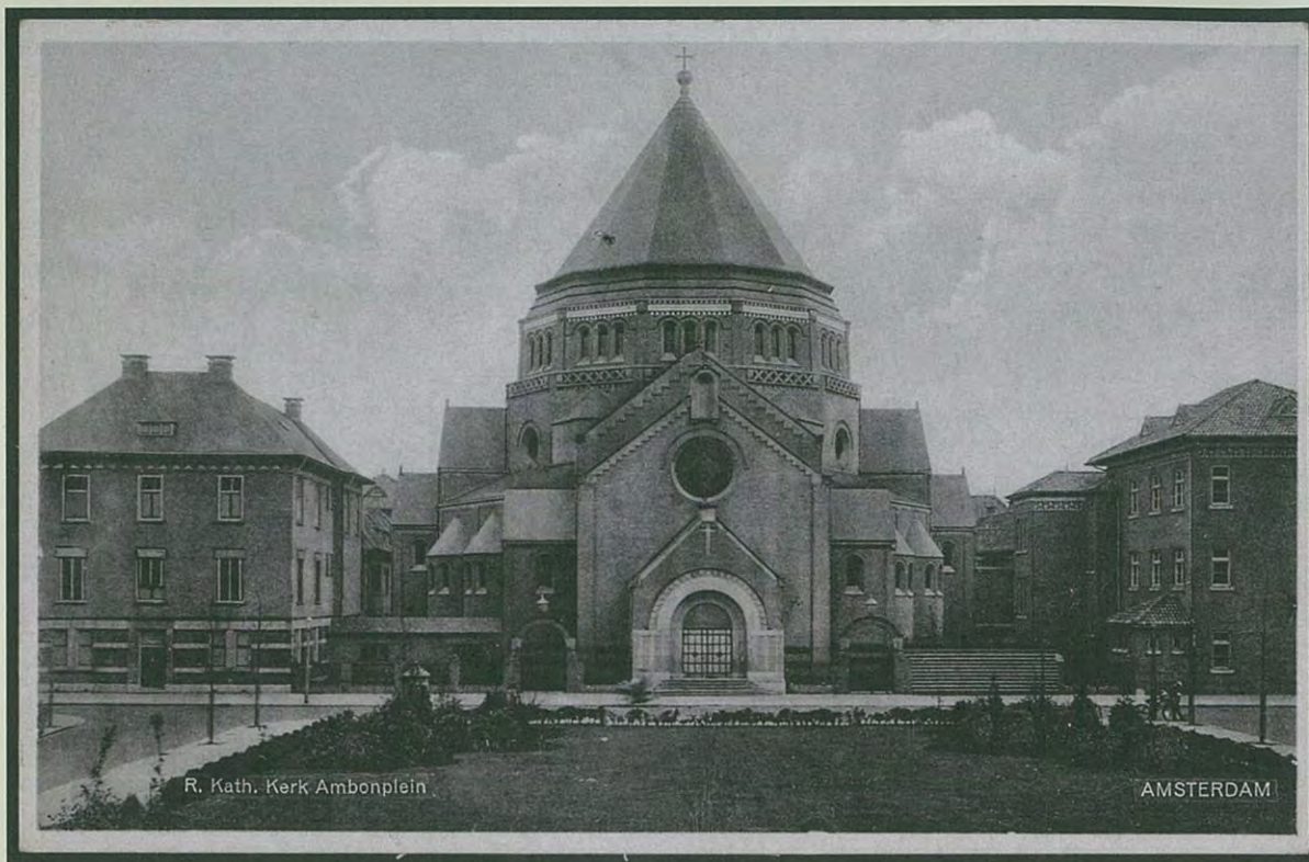
Gerardus Majellakerk met omliggend complex en Ambonplein, 1930, prentbriefkaart Stadsarchief Amsterdam.