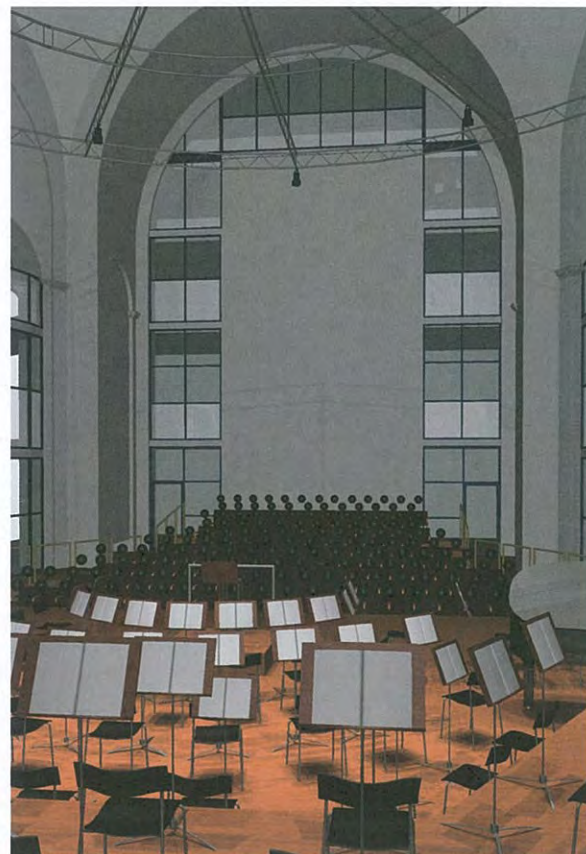
Ontwerptekening grote zaal, 2010, Zaanen Spanjers cs Architecten.

Hij heeft het over het meedenken met een potentiële huurder die een programma van eisen heeft waaraan moet worden voldaan. Door actief te participeren in het denk- en ontwikkelproces is Stadsherstel de beste partij gebleken voor het NedPhO. Dat lijkt bijna vanzelfsprekend als je Morel hoort praten, maar niets is minder waar. Het is hard werken al is het natuurlijk wel zo dat Stadsherstel veel ervaring heeft met vijftien kerken in exploitatie. Al met al een zeer interessant project om in 2012 te blijven volgen. ■