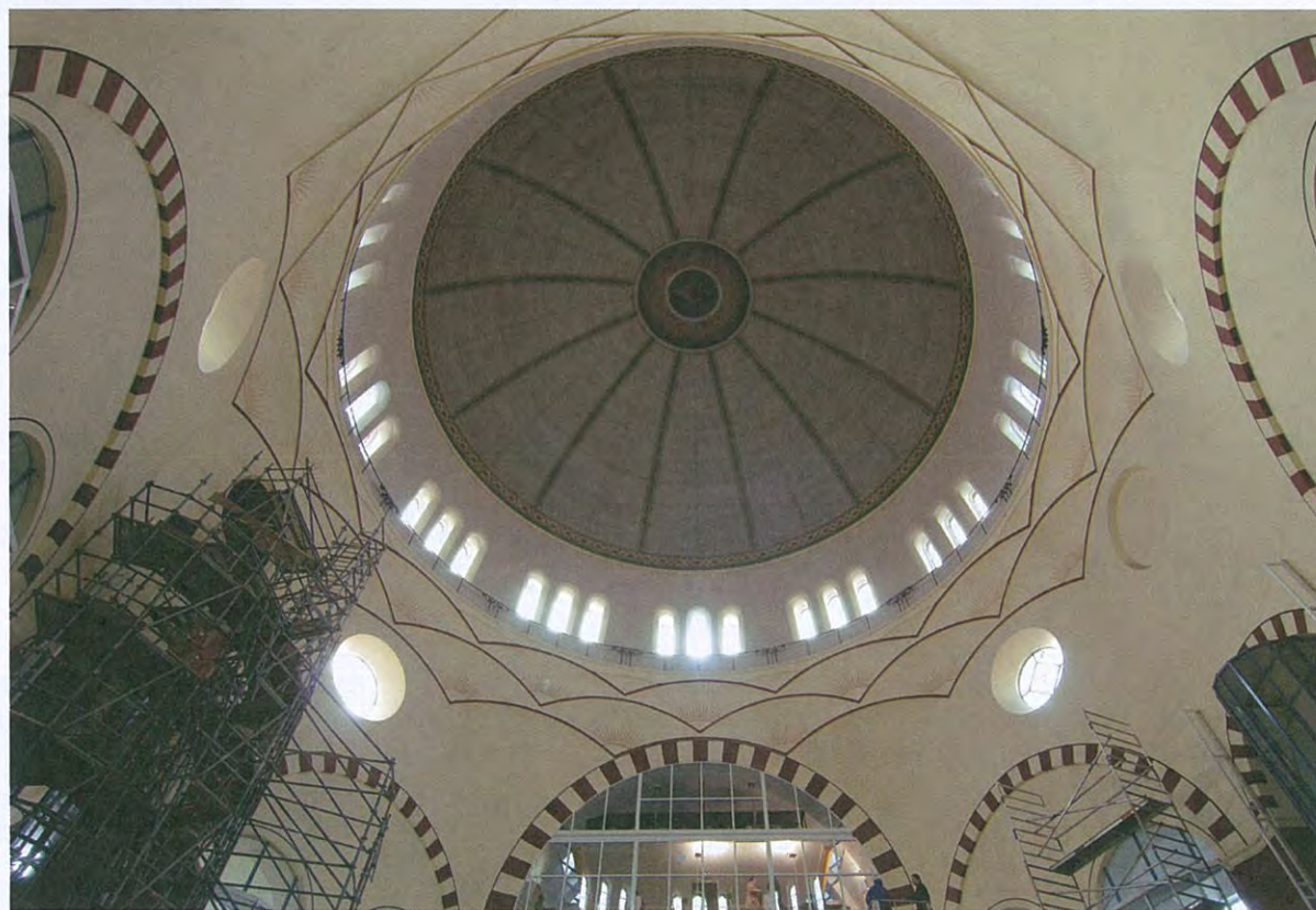
Koepelgewelf en steigerconstructie, 2011, foto Ernest Annyas.