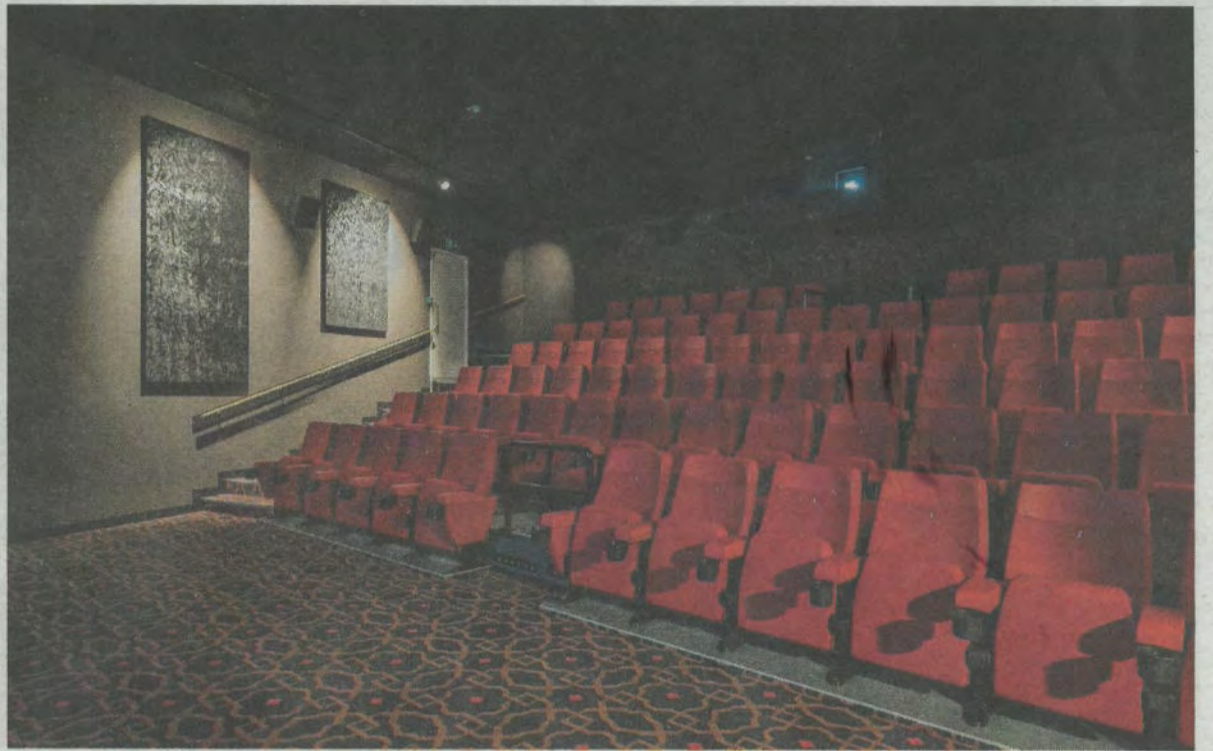
De zalen van de Filmkoepel worden ook gebruikt voor colleges en bedrijfspresentaties.