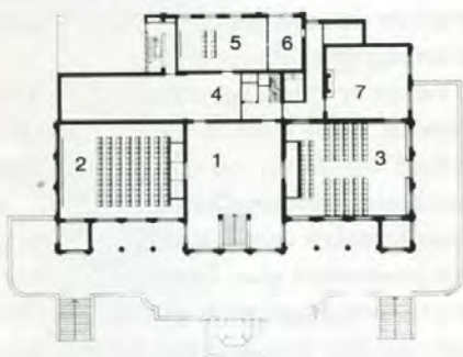
Plattegrond van de bel-etage met 1. hal. 2. filmzaal. 3. Parisien-zaal. 4. affichegalerij. 5. viewingruimte. 6. filmcabine. 7. Franse zaal.