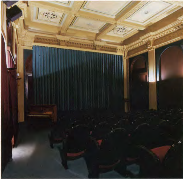
In een vroegere balzaal stuitte men na het verwijderen van twee over elkaar heen aangebrachte plafonds op het originele classicistische plafond uit 1878. De lambrizing, die van latere datum is, werd versoberd.