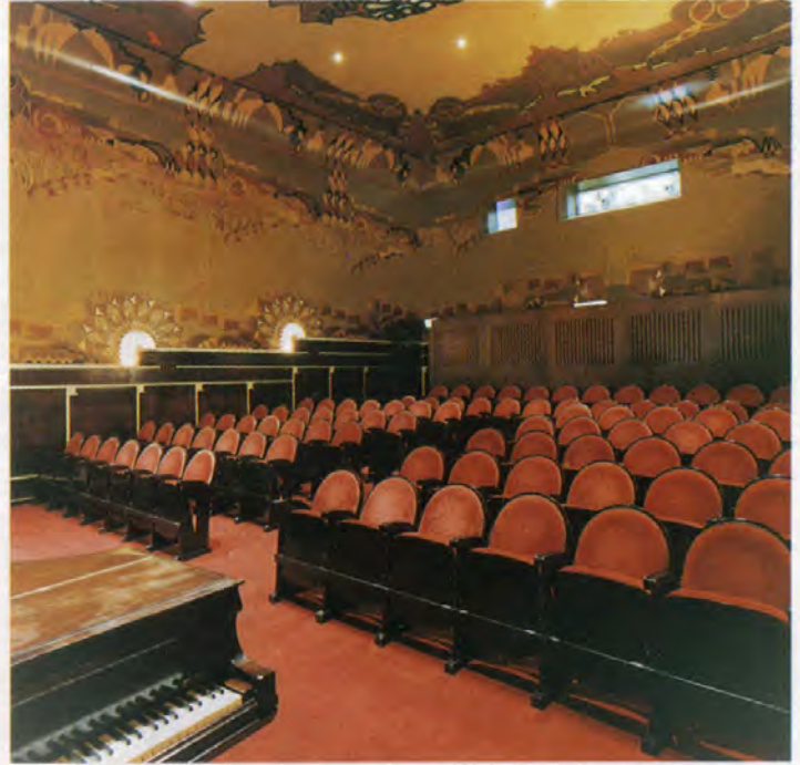
Uit de voormalige bioscoop Parisien - een van de oudste van Nederland - kwamen met het Art Deco-interieur mee de oorspronkelijke lambrizingen, verlichtingsarmaturen en beschilderde wandbespanningen. Het plafond is een reconstructie.

de beschilderde wandbespanningen wel waren meegenomen speelde een heel ander probleem: de beschilderde wandbespanningen waren gedurende hun vierjarige opslag niet alleen sterk uitgedroogd - met alle problemen van dien - maar bleken ook niet meer maatvast te zijn. Van de paarsgewijs met de ruggen tegen elkaar opgerolde doeken was er telkens één iets opgerekt en één iets ingedrukt. Opnieuw opspannen was onmogelijk. Restaurateur Ariël de Klerk vond een oplossing in het op panelen plakken van de doeken.